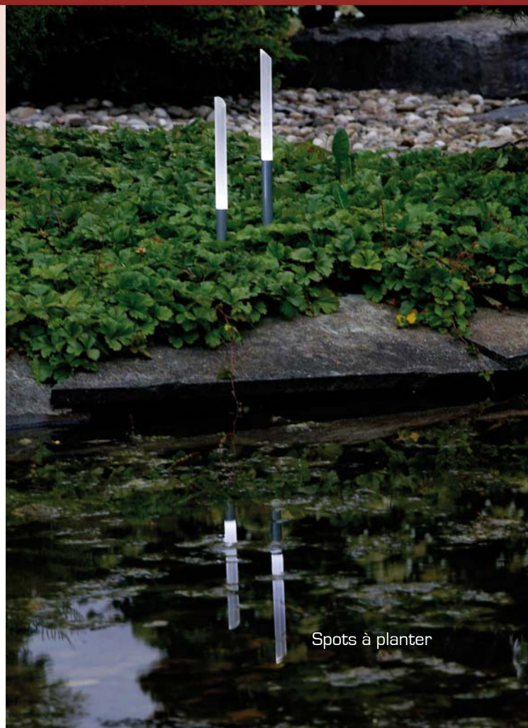
Spots à planter

Deck-Linéa, le spécialiste de la terrasse en bois et de l'aménagement extérieur, a développé une large gamme d'éclairages de jardin, esthétique et contemporaine. Spots muraux pour illuminer une façade, spots à planter ou sur potelet pour baliser une allée, et spots encastrables pour créer une ambiance chaleureuse sur une terrasse ou délimiter des marches d'escalier, sont autant de solutions lumineuses, décoratives et faciles à installer proposées par Deck-Linéa.