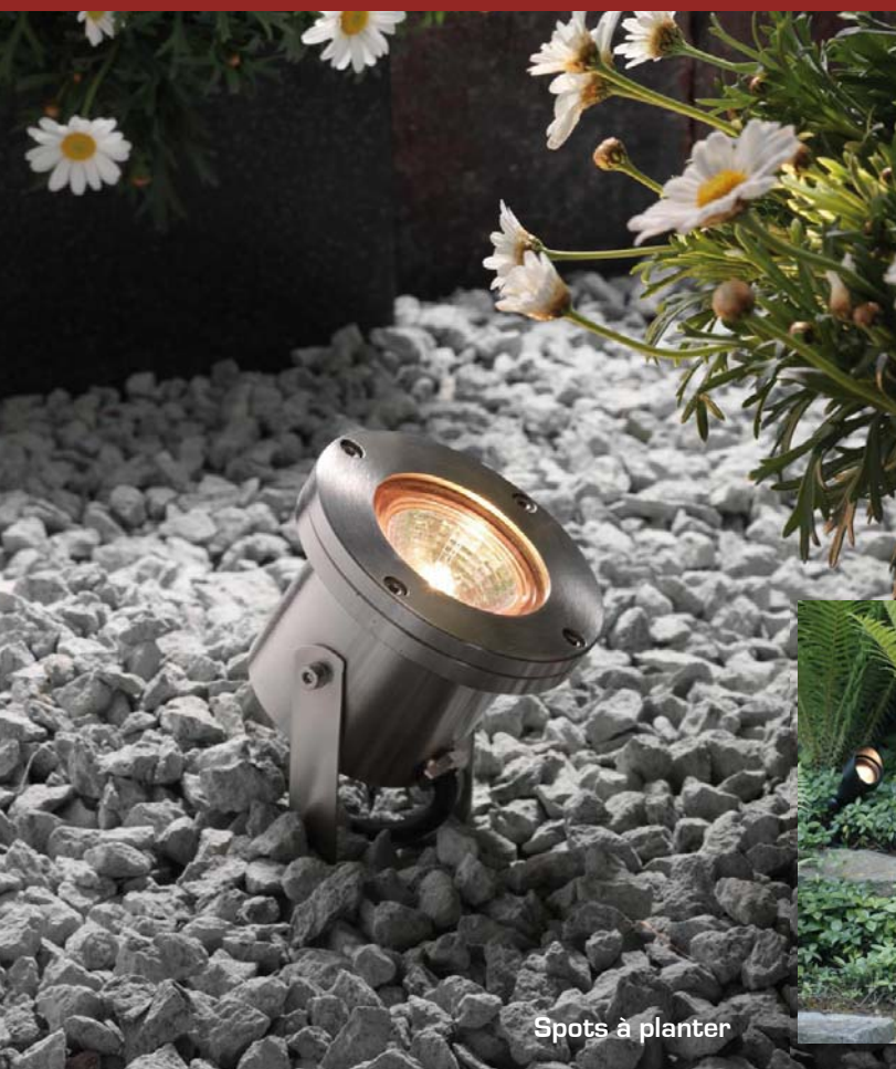
Spots à planter