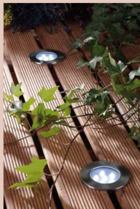
Spots à encastrer